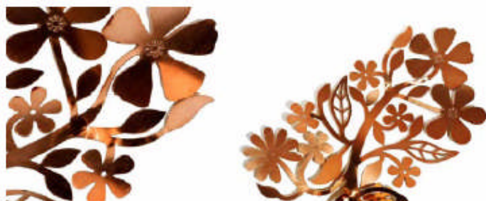
Flora , Tord Boontje