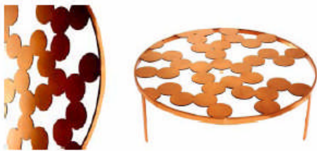
Bubble , Nendo