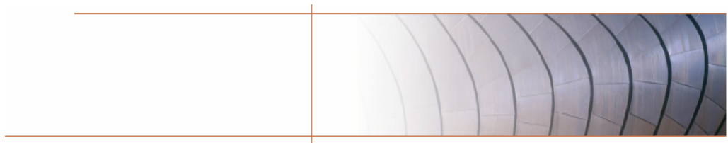
Bytový komplex Frederikskaj, Dánsko (architekt: Dissing+Weitling arkitektfirma )